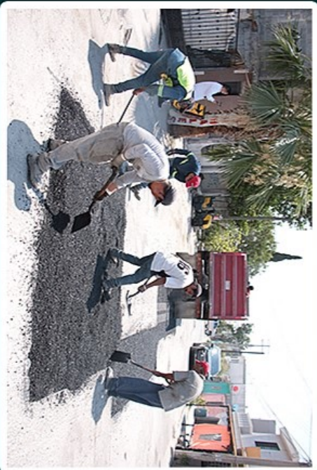
ARRANGA AL CALDE OBRAS DE PAVIMENTACIÓN EN VARIAS COLONIAS DE JUÁREZ