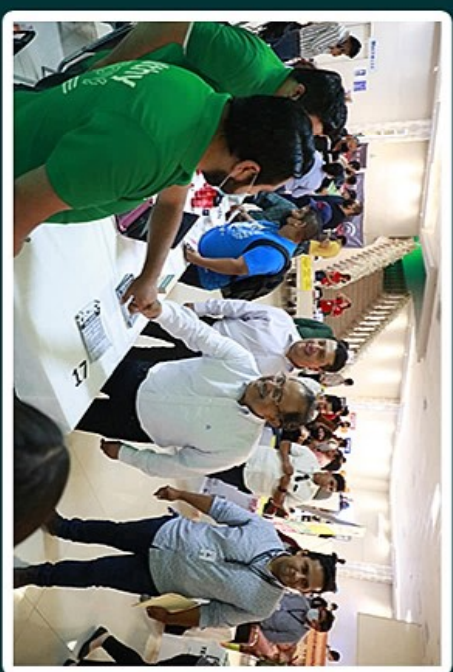
GRAN FERIA DE EMPLEO EL MUNICIPIO DE ESGOBEDO